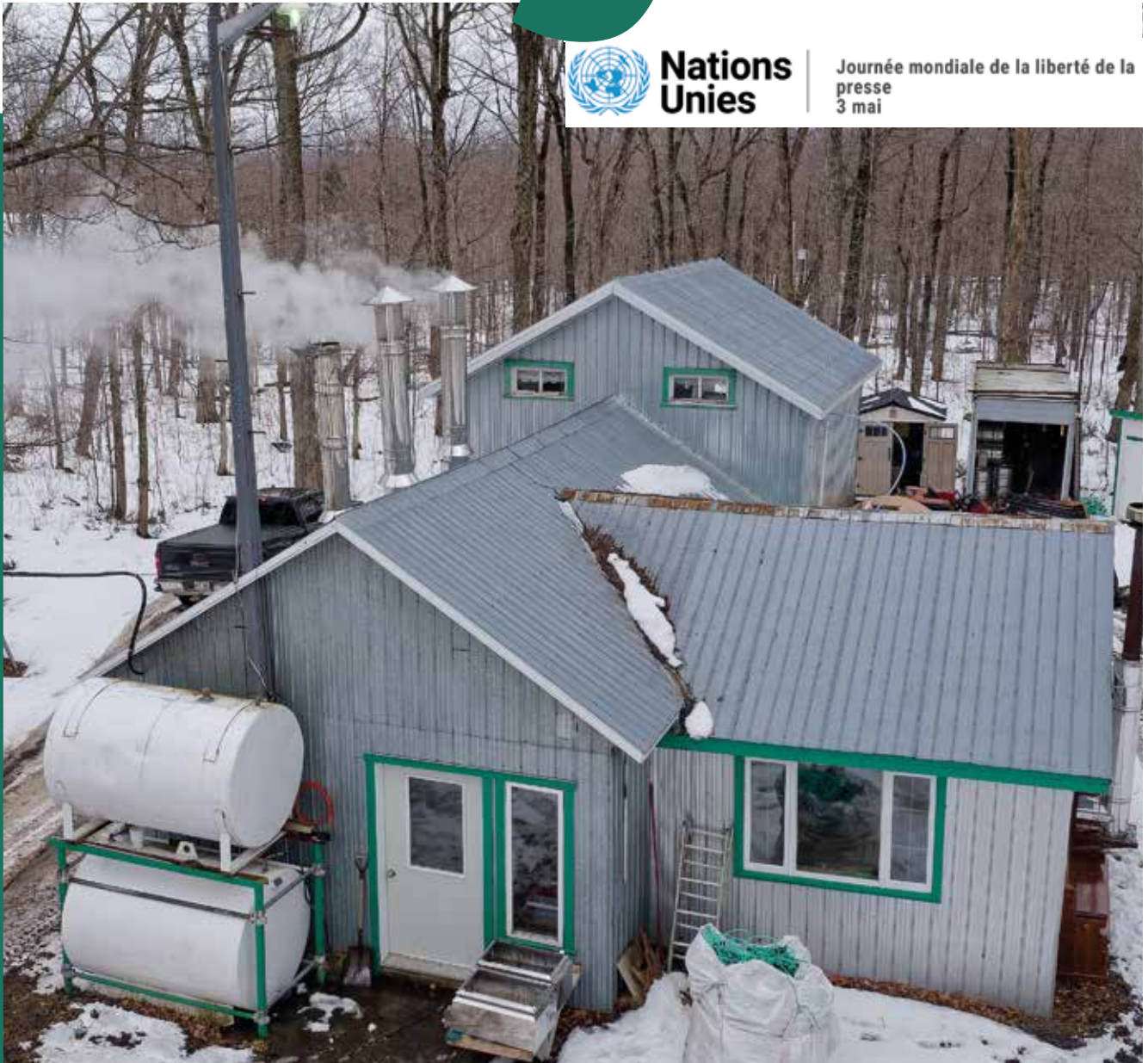
Une bonne année des sucres chez Réjean Boutin

Journée mondiale de la liberté de la presse 3 mai