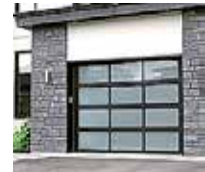
PORTES DE GARAGE